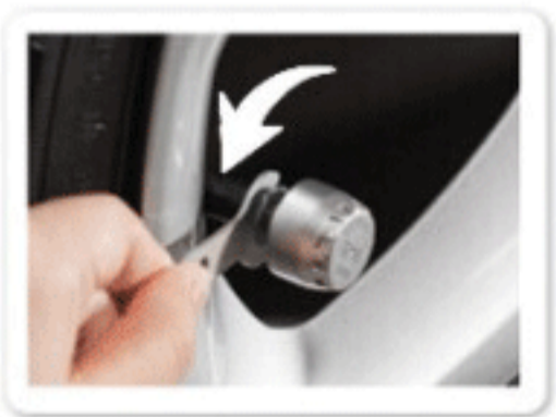
4 用螺母扳手反向逼紧传感器