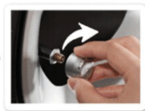
3 按传感器外壳位置标识，旋入对应轮胎并拧紧