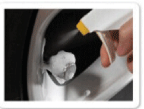
5 用肥皂水检查是否漏气